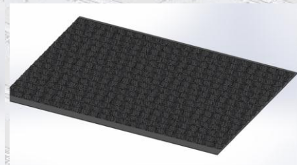
100kW + anlæg